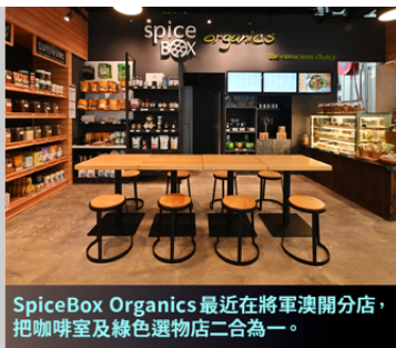
SpiceBox Organics 最近在將軍澳開分店，把咖啡室及綠色選物店二合為一。