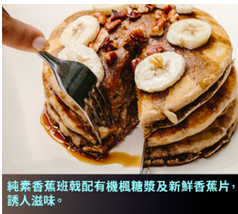
純素香蕉班戟配有楓糖漿及新鮮香蕉片，誘人滋味。